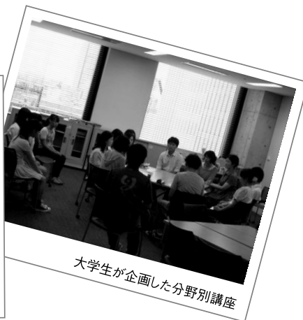
大学生が企画した分野別講座

このイベントは、大学や企業、行政、NPOなど、多様な主体が連携しながら開催をしています。今後もこういった多様な主体で連携しながら、この地域のボランティア活動を大いに盛り上げていければと思います。