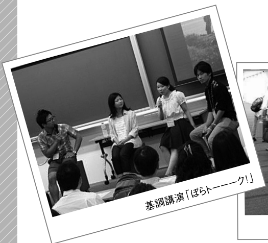
基調講演「ぼらトーーク!」

今回、特に目立ったのは、若者の力です。会場が大学ということもあり、基調講演をはじめ、会場運営、受付、講座、団体へのインタビューなど、多くの場面で、たくさんの若い力が活躍しました。