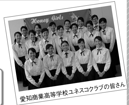
愛知商業高等学校ユネスコクラブの皆さん

ミツバチという一つの生物から、環境問題へのアプローチができたり、蜂蜜を使用することで復興応援ができたり、フェアトレードの活動もできるなど活動の幅が広がっています。何をやるにも一つのことには打ち込むことが大切だと思います。まずは、何か少しでも行動を起こすことから始めてほしいです。たとえば、心が込められている商品を食べることから社会貢献を始めることもできると感じています。