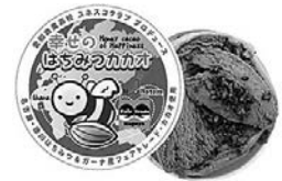
未来につながるフェアトレードアイス 「幸せのはちみつカカオ」

苦労というわけではないのですが、一つの商品をつくるのにも様々な過程があり、商品のネーミングやチラシやパッケージデザイン、販路の確保などすべて自分達で行っているの、試行錯誤の繰り返しで時間がかかるのを実感します。ですが、その過程の中で様々な人たちとつながることができ、そこから知らなかったことを知ったり新たな世界が拡がり、また次の商品開発につながると感じています。