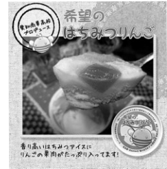
東日本大震災復興応援アイス 「希望のはちみつりんご」

たとえば、蜂蜜を使用したアイスクリームがあるのですが、東日本大震災の復興を応援したいという思いで「希望のはちみつりんご」という商品を作りました。また、フェアトレードのワークショップに参加したことをきっかけにガーナの労働の現状を知り貢献をしたいという思いから、ガーナ産のカカオを使用した「幸せのはちみつカカオ」アイスという商品を開発したりしています。